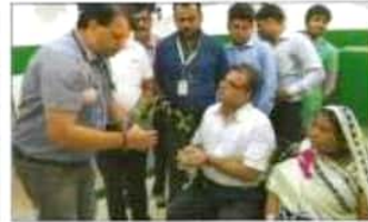
सर्वोपरम डिप्टी पर परामर्श देने करने के लिए इस के पदक