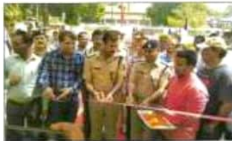
दुर्घटना घटित होने पर कार्यवाही करने के लिए