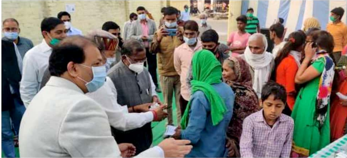
Free Medical Camp at Breathe Easy Multi Specialty Hospital, Ramnagar