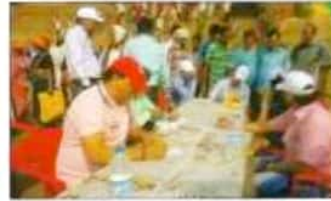
सर्वेदा प्रसारण पर परामर्श के नि. शुभक परामर्श देने की इस के पदक