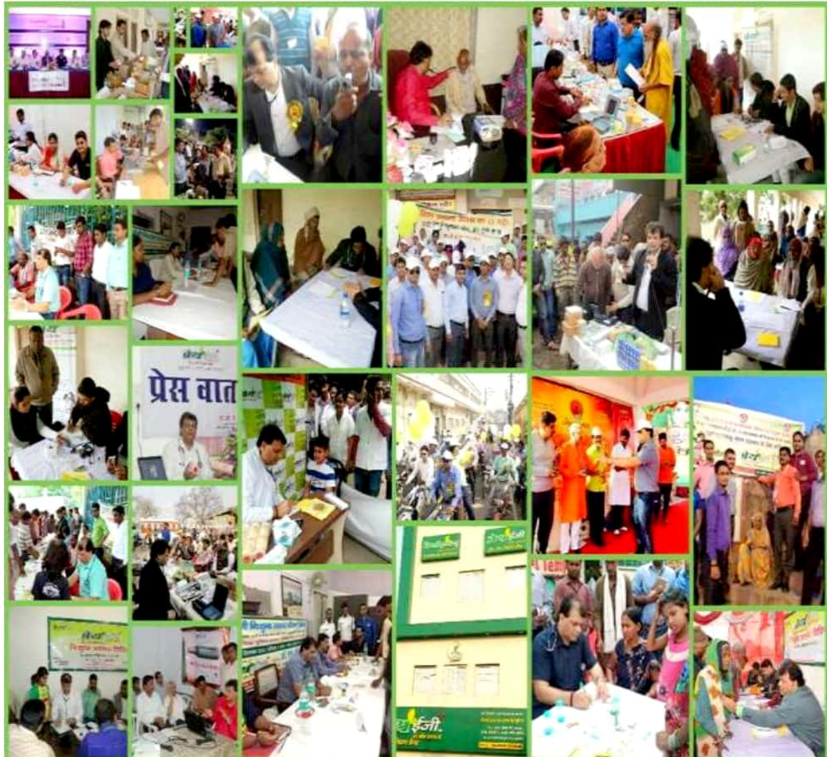
चिकित्सा के क्षेत्र में २०१० से कार्यरत ब्रेथ ईजी चेस्ट फाउंडेशन फॉर ह्यूमैनिटी