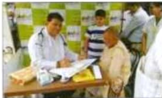
डिप्टी डॉक्टर के साथ परामर्श के नि. शुभक परामर्श देने की इस के पदक