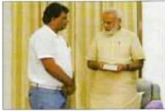
श्री नरेन्द्र मोदी जी, भारतीय प्रधानमंत्री से मुलाकात करते