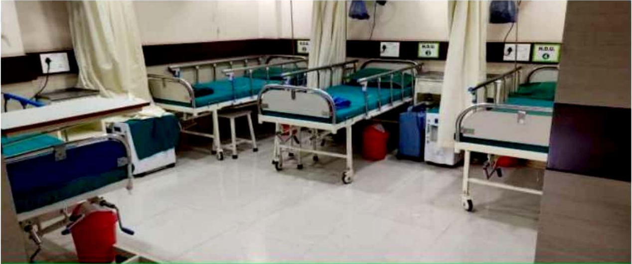
Breathe Easy Hospital – HDU Ward