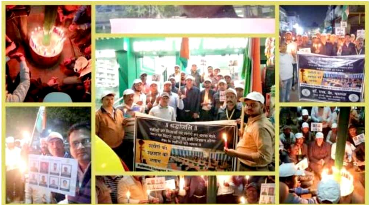
पुलवामा अटैक में शहीद जवानों की शहादत को याद करते ब्रेथ ईज़ी चेस्ट फाउंडेशन फॉर ह्यूमैनिटी सदस्य