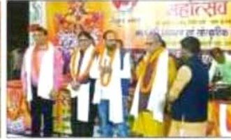
सबसे बढावा देने में आवेगित कर कार्यक्रम पर विशेष सम्मान प्राप्त करने की. इस के पदक