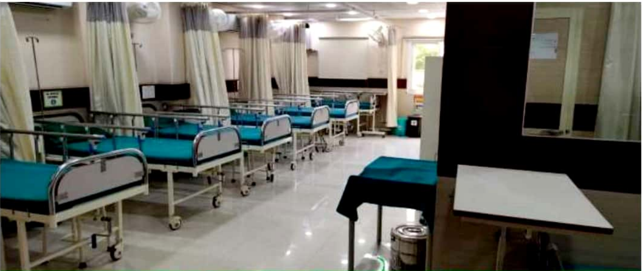
Breathe Easy Hospital – Special Ward