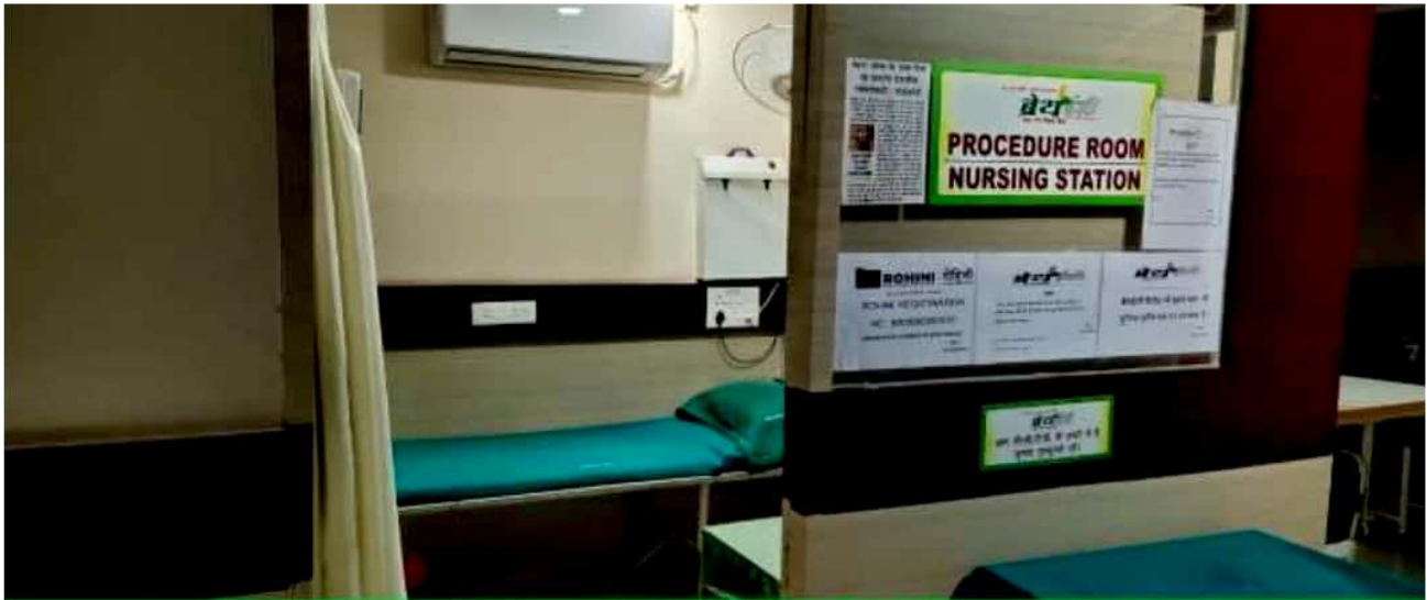
Breathe Easy Hospital – Nursing Station