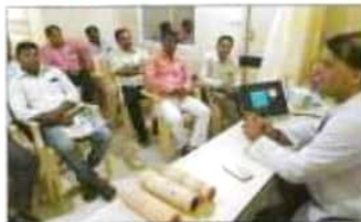
विश्वविद्यालयीय सेमिनार को सम्बोधित करने की. इस के पदक