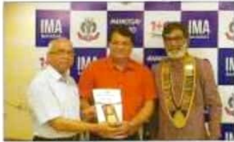
पारलमण्टी के अर्द्ध सत्र के अवसर पर बी.ई.सी.सी. डॉक्टर के द्वारा डॉक्टर से सम्बन्ध बनाए करने की. इस के पदक