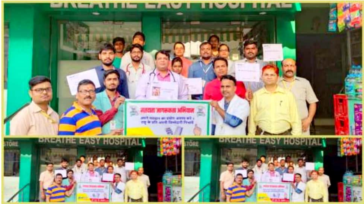
Creating Awareness amongst public for Lok Sabha Voting 2019