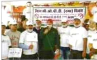
डिप्टी सी.ओ.पी.डी. डिप्टी पर सम्मानकृत करने