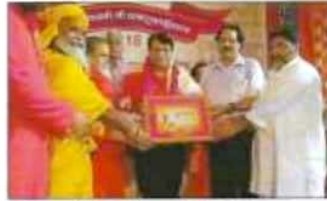
बहुमूल्य धार्मिकनेतृत्वों के साथ इस करने की इस के पदक