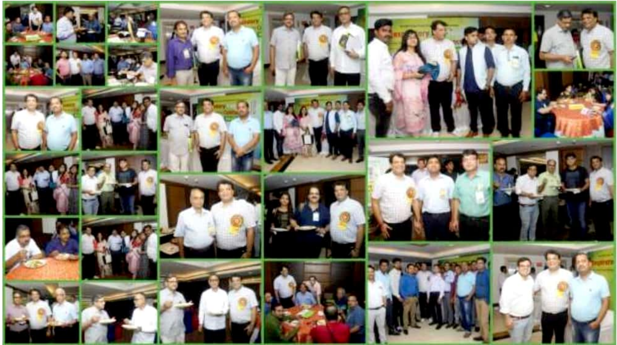
Faculties, Pannellists, Attendees during dinner - Respiratory Conclave Conference 2018