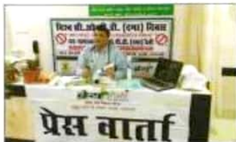
बढ़ते हुए आयु परामर्श पर परामर्श करने की इस के पदक