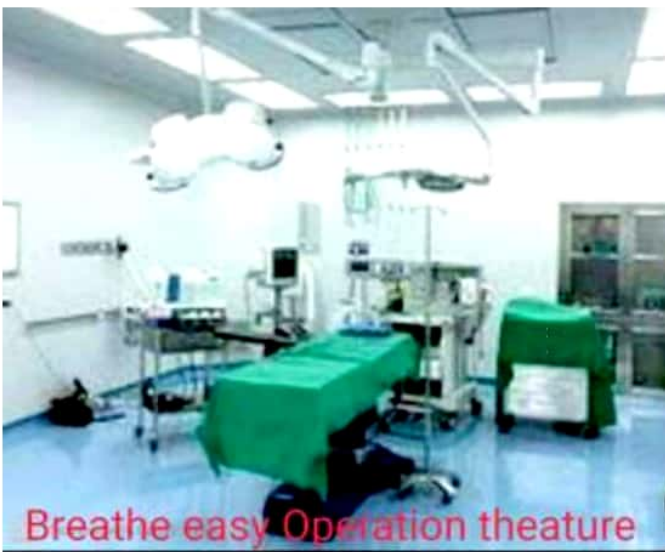
Breathe easy Operation theatre