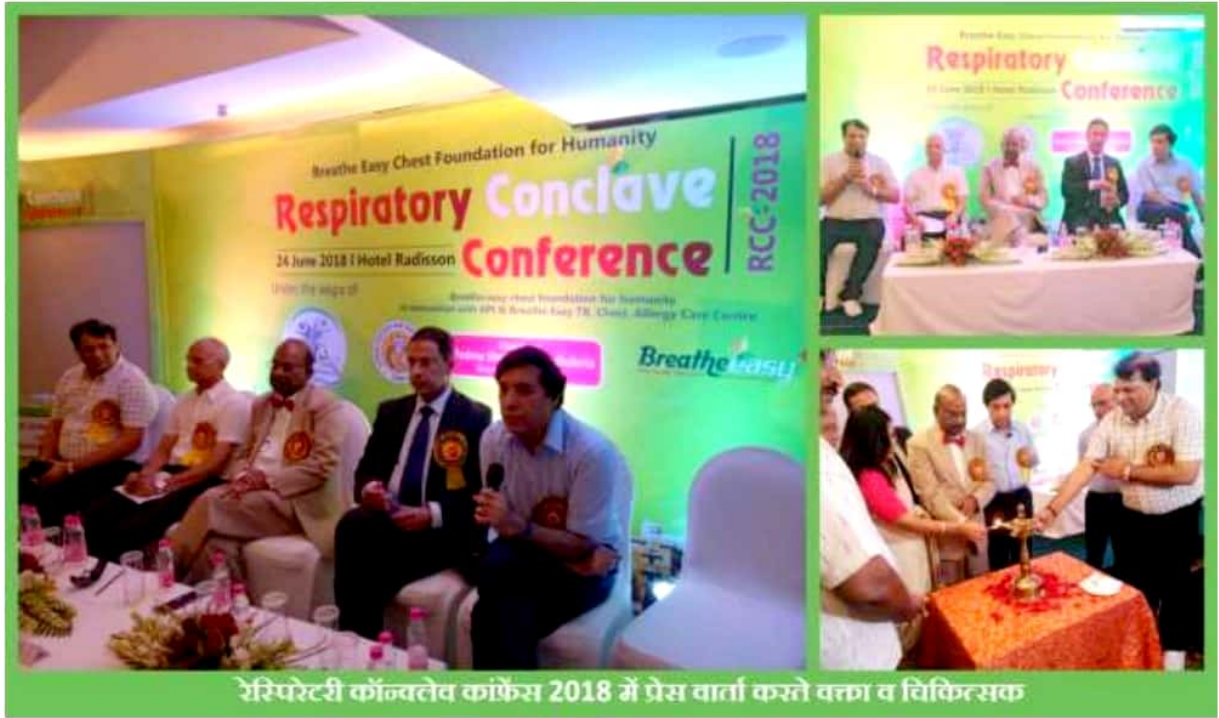
रेस्पिरेटरी कॉन्क्लेव कॉन्फेंस 2018 में प्रेस वार्ता करते वक्ता व विफिटसक