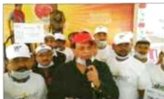
विश्व अल्पम आयु डिप्टी सम्मानकृत करने